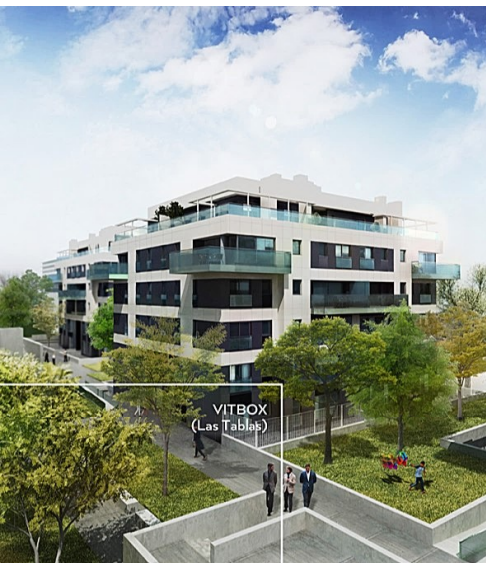
VITBOX (Las Tablas)