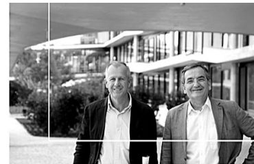
Íñigo Ortiz y Enrique León

"Todas las viviendas son exteriores y responden al esquema de zonificación día-noche. Zona de día, compuesta por salones y cocinas, y zona de noche, con dormitorios y aseos, esta sencilla distribución genera un excelente funcionamiento interior. Cada una posee un sistema de recuperación de aire que garantiza el confort sostenible en la vivienda. Además, su forma escalonada consigue el objetivo de generar grandes terrazas, espacios exteriores vivideros de gran valor que quedan unidos a la vivienda a través de la zona de día y logran incrementar el valor de cada una.